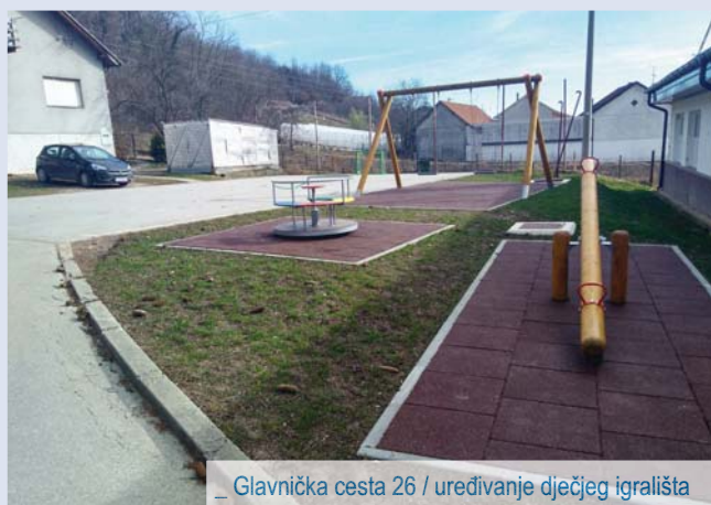
_ Glavnička cesta 26 / uređivanje dječjeg igrališta