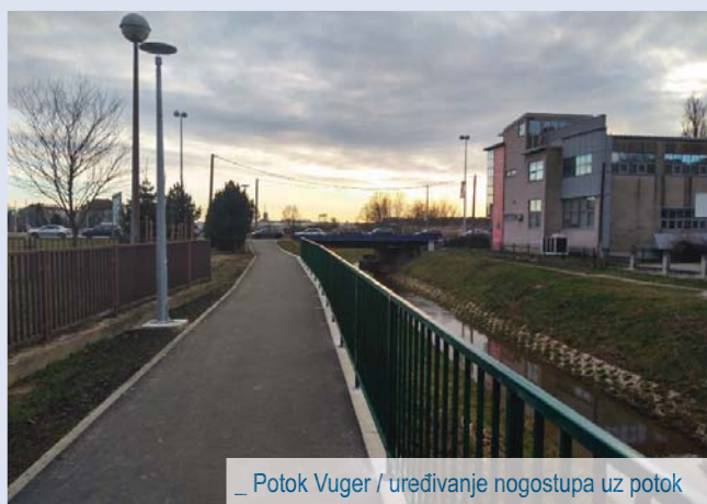
_ Potok Vuger / uređivanje nogostupa uz potok