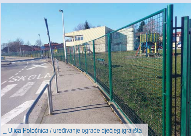
_ Ulica Potočnica / uređivanje ograde dječjeg igrališta