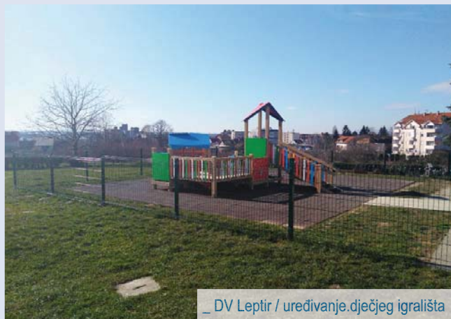
_ DV Leptir / uređivanje dječjeg igrališta