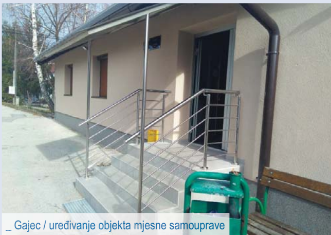
_ Gajec / uređivanje objekta mjesne samouprave