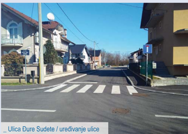
_ Ulica Đure Sudete / uređivanje ulice