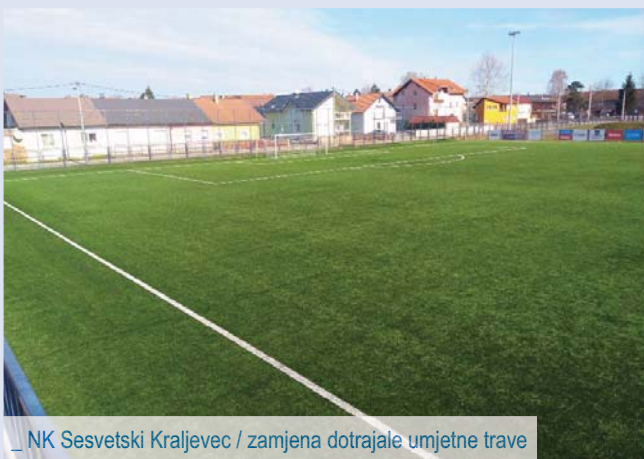
_ NK Sesevski Kraljevec / zamjena dotrajale umjetne trave