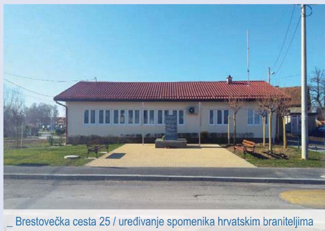
_ Brestovečka cesta 25 / uređivanje spomenika hrvatskim braniteljima